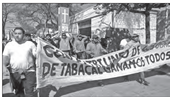
Marcha y represión