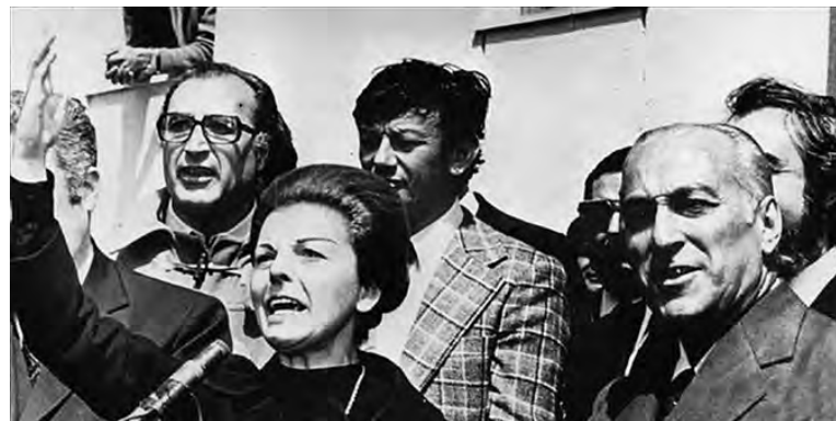
Isabel Perón y López Rega

Los trabajadores, al derrotar al lopezreguismo y al Plan Rodrigo, hirieron de muerte al gobierno peronista de Isabel.