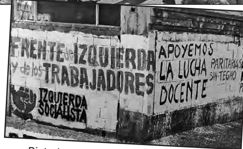
Pintada de nuestro partido en Bariloche en apoyo al paro docente

Sobran razones para profundizar la lucha y participar en el acto que se realizará en Plaza de Mayo el próximo viernes 2 de septiembre, donde culmi-