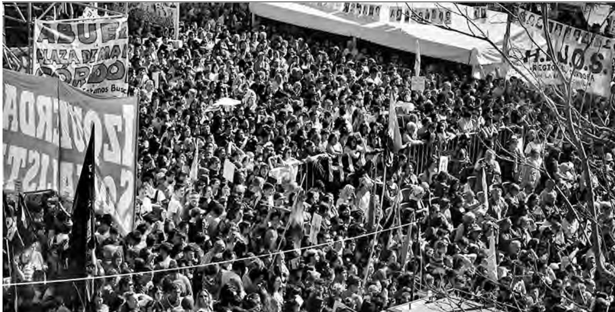
Concentración frente a los tribunales

del que se probó que es varón y nació el 14 de junio de 1976.