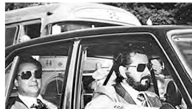
Patota de las Tres A

Si bien la Triple A iba contra la guerrilla, el centro era golpear y aplastar al movimiento obrero y a los sectores populares. En marzo del '75 la huelga de los metalúrgicos de Villa Constitución, aunque se perdió, marcó el grado del ascenso obrero. López Rega e Isabel trataron de dar un paso decisivo en la derrota de los trabajadores anulando las convenciones paritarias en el marco de un terrible plan de ajuste,