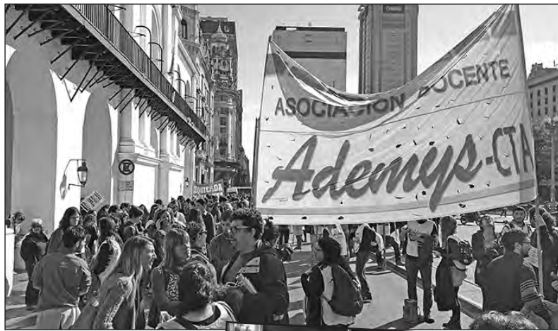
Movilización del combativo sindicato docente Ademys de Capital

Los docentes seguimos reclamando la reapertura de las paritarias. Participaremos de la Marcha Federal a Plaza de Mayo exigiendo plan de lucha nacional de Ctera y paro general.