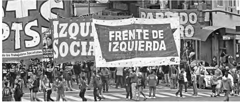
"Desde Izquierda Socialista siempre hemos llamado a postular al FIT"

Pero los compañeros del Partido Obrero se olvidan de señalar en su carta que hubo otra oportunidad desperdiciada que tuvimos para avanzar en una acción unitaria contra el gobierno, la patronal y la burocracia. Nos referimos al fracasado encuentro de los sectores sindicales combativos que estaba programado para el 5 de marzo en Racing. No es casual que