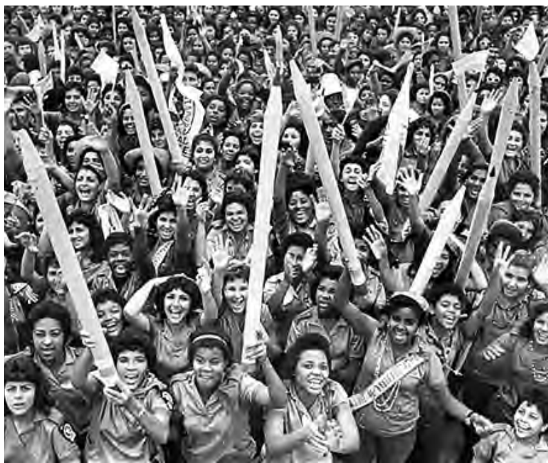
Cuba. Cierre de la campaña de alfabetización el 21 de diciembre de 1961.

a los países latinoamericanos. Los deportistas cubanos, que antes no figuraban, empezaron a brillar. Los logros en educación, salud y deporte en Cuba fueron reconocidos hasta por el propio imperialismo.