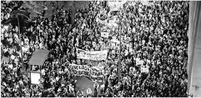
Vista de la marcha

En este contexto se produjo esta ola de asesinatos, varios en intentos de robo. La masiva movilización centró su exigencia en justicia para los casos más recientes, y para varios casos de homicidio donde hay